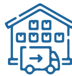
Lojistik Merkezleri Logistics Centers