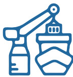
Limanlar ve Denizcilik Ports and Maritime