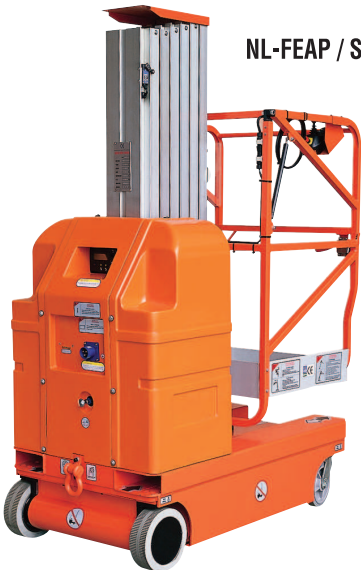
NL-FEAP / S