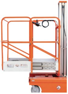
Opsiyonel / Optional: Genişletilmiş platform/ Extended platform