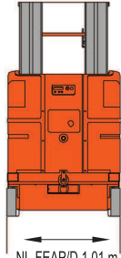
NL-FEAP/D 1.01 m NL-FEAP/S 0.82 m