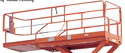
• Platform genişletme