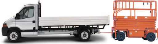
• Çekici yardımıyla platform nakli