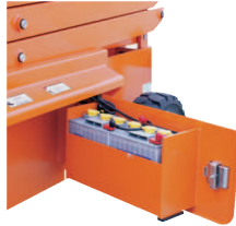
• Yandan açılır akü hazneleri