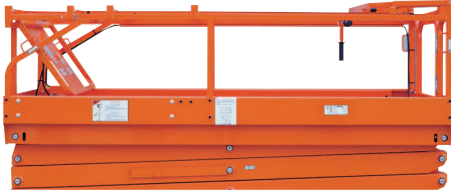
• Katlanabilir korkuluk sistemi