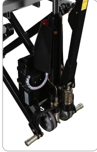
400 mm in altında transpalet olarak görev yapar.