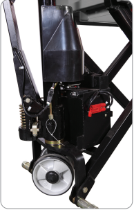
200 kg.'a kadar olan yükleri "hızlı kaldırma" fonksiyonu ile daha hızlı kaldırır.