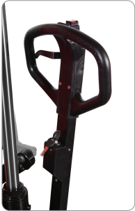
Aküli modellerde yer alan anahtar