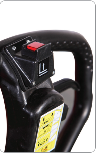
Akü ile kaldırma işlemi artık daha kolay ve hızlı